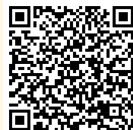
Contoh Tanda Terima Sample Receipt