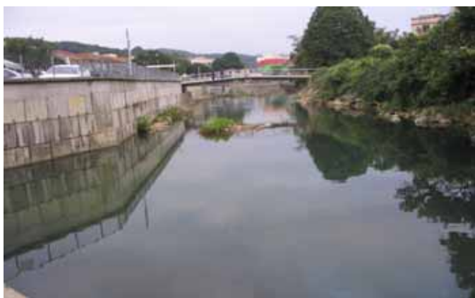
地點五：住宅及工廠傍