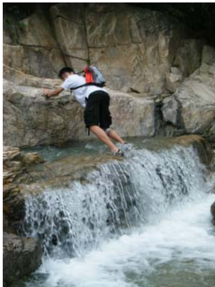
步步為營、舉步為艱