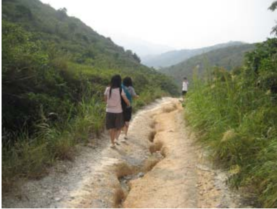
同學們正前往水源。